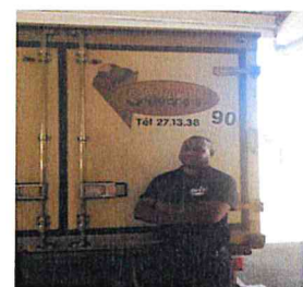
Société SWITI (glacier)