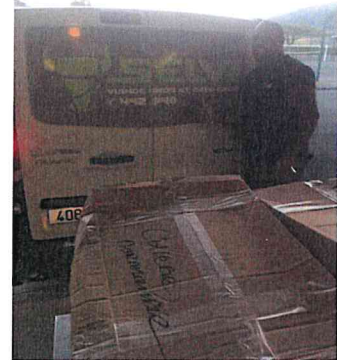
Livraison avec Sct SELVI