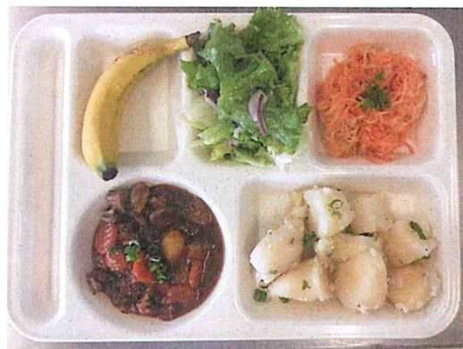
Salade verte, salade de papaye et citrouille râpées Civet de cerf accompagné de pommes de terre Banane