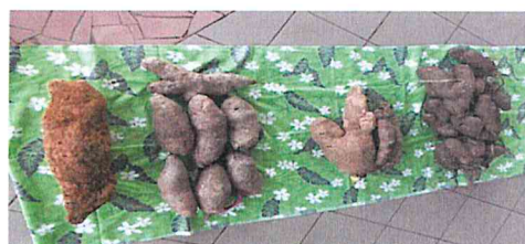
Récolte du projet de nos élèves (champ d'ignames)