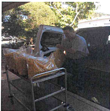
Société La Bolognaise