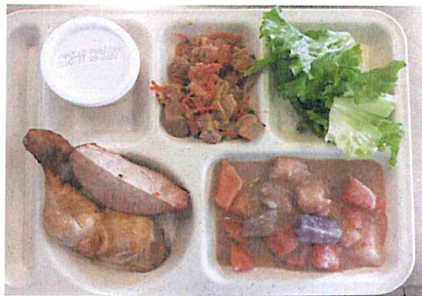
Salade de poisson, salade verte Cuisse de poulet accompagné Légumes (tubercules) au lait de coco Glace vanille fruit de la passion

COLLEGE DE NORMANDIE LUTTE CONTRE LE GASPILLAGE ALIMENTAIRE