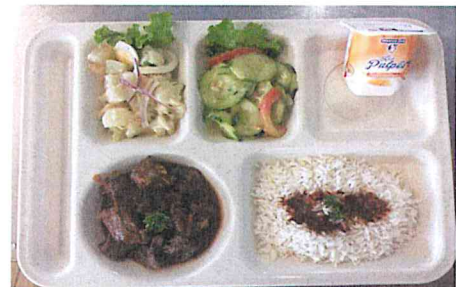
Salade de chouchoutes, salade de concombres Chili Con Carne accompagné de riz (locale) Yaourt pulpé aux fruits