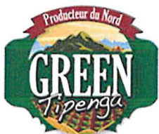
Fournisseur 4eme Gamme