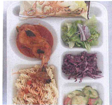
Assortiments de crudités Poulet Basquaise accompagné de pâtes Mini-Giga